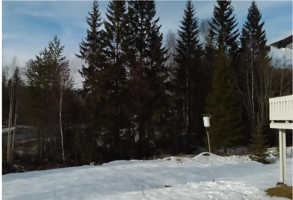
Figur 2. Støvnedfallsbøtten ved Østsida 245.

Analysen måler total mengde vannuløselig (mineralsk) støv, og beregner mengden per kvadratmeter i løpet av 30 dager +/- 2 dager.